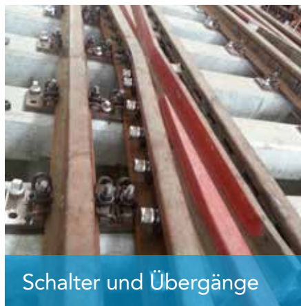
Schalter und Übergänge